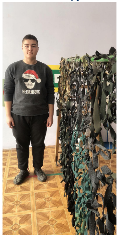
Опитульванник підготувала Березюк Л.В., майстер виробничого навчання