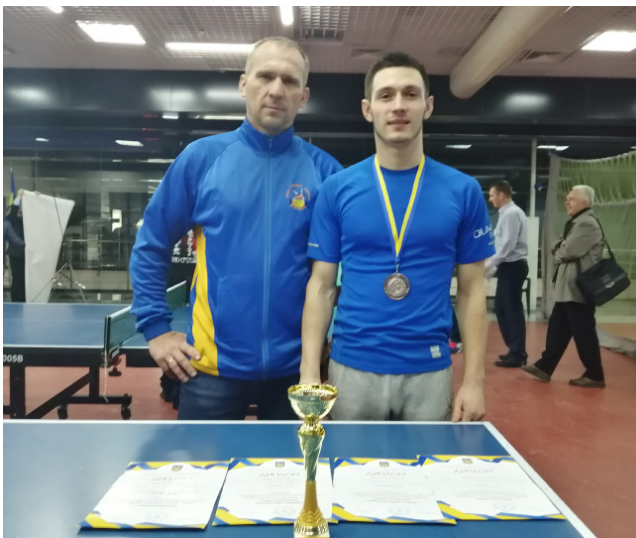
перемогти. Тому дуже приємно відзначити той факт, що збірна команда Вінницької області з настільного тенісу у загальнокомандному заліку виборола III загальнокомандне місце та стала бронзовим призером Всеукраїнської Спартакіади серед ПТНЗ.

Змагання склалися з трьох видів програми – це особистий розряд, де кожен учасник змагався окремо, парний розряд, тут змагалися пари юнаків та дівчат між собою, і змішані пари. Протягом трьох днів на десяти тенісних столах відбувалися тенісні баталії, сутички були дуже цікавими і запеклими. Всі спортсмени демонстрували гру на дуже високому технічному рівні, емоції зашкалювали, та врешті-решт вигравав той, у кого були міцніші нерви. У цих змаганнях брали участь спортсмени майже з усієї України і кожен прагнув