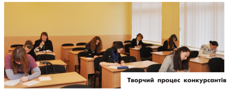
Творчий процес конкурсантів