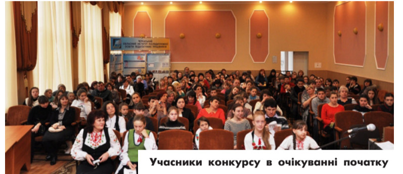
Учасники конкурсу в очікуванні початку

Учіться, читайте, і чужому навчайтесь, Й свого не цурайтесь. Бо хто матір забуває, того бог карає, Того діти цураються, в хату не пускають. Т. Г. Шевченко