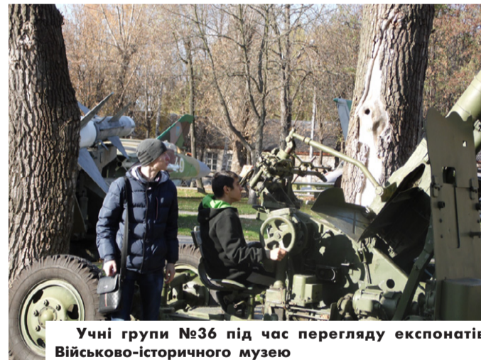
Учні групи №36 під час перегляду експонатів Військово-історичного музею

Хоч як цікаво не було б на парах, але відпочинок між ними нам необхідний. Дивна ця "п'ятихвилинна" перерва! Встигаєш вивчити вірша, зайти на сторінку соціальної мережі, прочитати цілий роман, вивчити формули і навіть поїсти! Саме так, фантазія у студентів неймовірна.