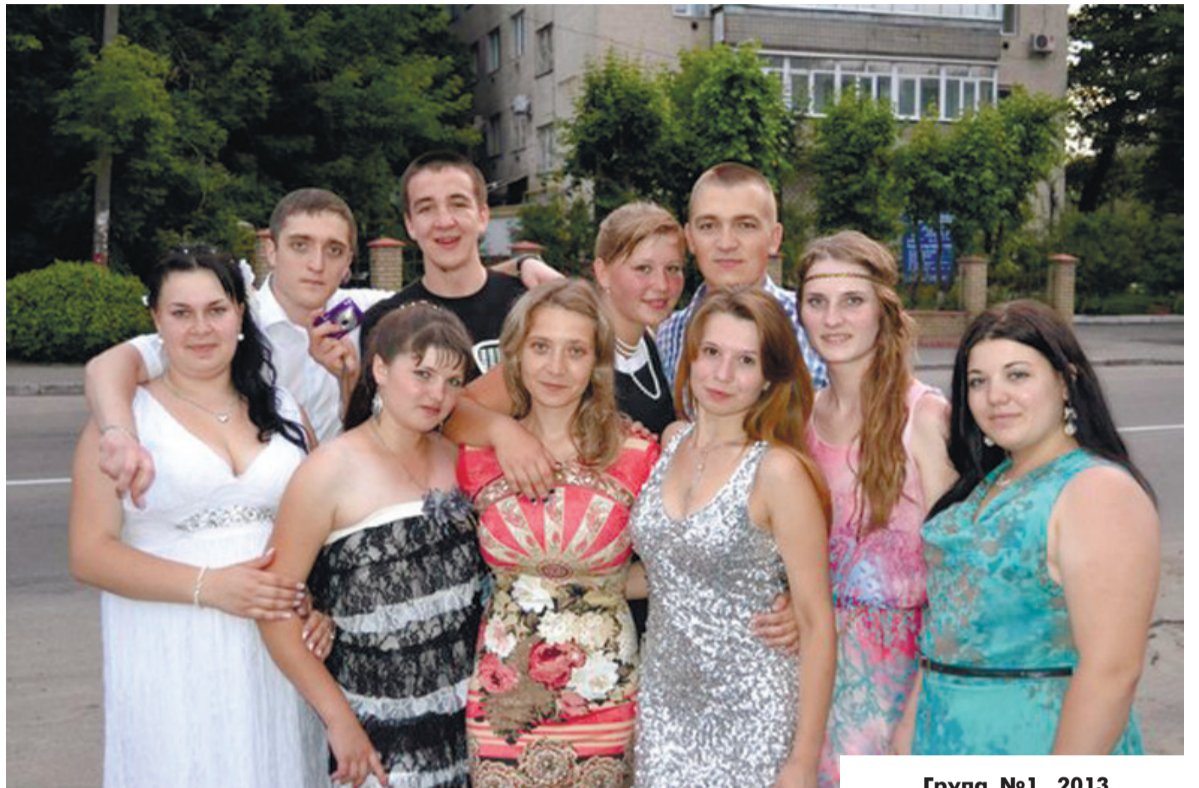
Група №1, 2013

Найбільшою гордістю та нео-ціненим скарбом майстра ви-робничого навчання є його учні-випускники - талановиті, висо-копрофесійні фахівці, щедрі й багаті душею, які невтомно пра-цюють створюють сприятливі умови для реалізації своїх твор-чих здібностей.