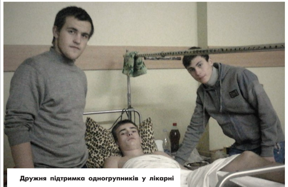
Дружня підтримка одногрупників у лікарні

Найголовніше для людини в житті - це її здоров'я. Адже недарма споконвіку відома фраза: "У здоровому тілі - здоровий дух!". Це дійсно так: якщо Ви здорові, значить - у Вас прекрасний настрій і будь-яка справа до ладу.