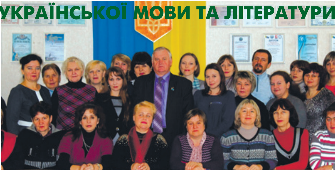
Учасники семінару викладачів української мови та літератури

12 листопада на базі нашого навчального закладу відбувся обласний семінар викладачів української мови та літератури професійно - технічних навчальних закладів на тему: "Підвищення мотивації до навчальної діяльності учнів на уроках української мови та літератури". Із вступним словом виступив директор навчального закладу, окреслив головні проблеми мовленнєвої політики сучасності, грамотності, знижений інтерес молоді до читання.