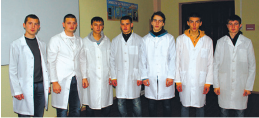
Учасники конкурсу фахової майстерності

Практичний тур полягав у перевірці навичок і вмінь із вимі-