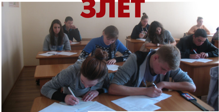
Учасники олімпіади з англійської мови

Фінішу пряму перетнуть останній етап олімпіади із різних навчальних дисциплін у нашому навчальному закладі. На цій інтелектуальній дистанції учням випала можливість оцінити рівень своєї підготовки з того чи іншого предмету. Умови олімпіадних завдань були оригінальними і потребували нестандартного рішення і високого рівня ерудиції.