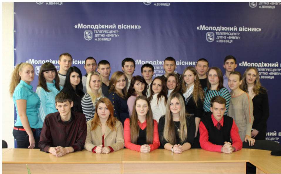
Члени учнівського самоврядування ДПТНЗ «ВМВПУ»

Адже День студента - це свято, яке не знає національностей і віку, це свято,