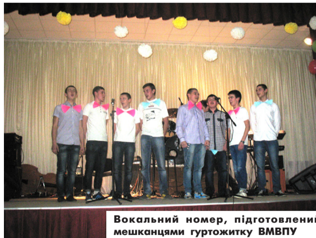
Вокальний номер, підготовлений мешканцями гуртожитку ВМВПУ

Все почалося о 16.30 год., коли усі зібрались у актовій залі на святковий концерт, під час якого виступали талановиті учні: лунали пісні, вірші, жарти. Особливого настрою додала пісня "Фелічіта" у виконанні хлопців, що прохивають у гуртожитку. А головним акордом концертної програми став