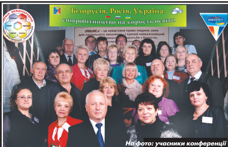
На фото: учасники конференції