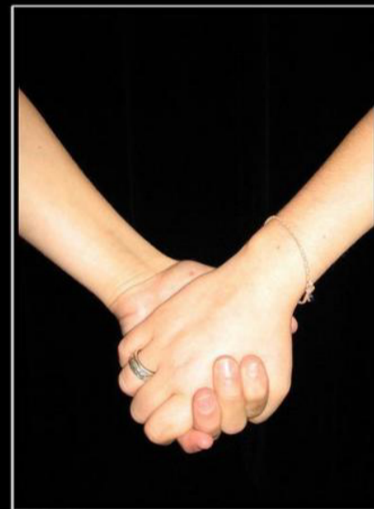
Найти хорошего друга это только половина дела, нужно ещё самому быть таким