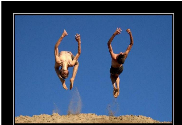
Настоящий друг- тот кто всю жизнь, с тобой плечём к плечу.

Хто скаже, що дружба не існує - значить йому не пощастило, він не мав справжніх друзів. Чи було таке, що ви посеред ночі бігли виручати друга? Чи не зважаючи на погане самопочуття допомагали йому, нічого не просячи в заміну? Задумайтесь, чи є ви для когось справжнім другом? Чи, може, з часом ваша дружба змінилась? Ви можете цього не помічати або сміло закрити на це очі, а в цей час віддалятися, змінювати коло знайомих, місця відпочинку, заглибившись у