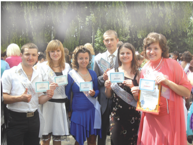
На фото: Учні випускної групи №27