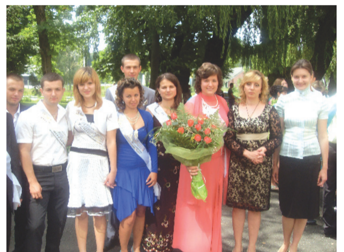
На фото: Учні випускної групи №27 із класним керівником та сурдоперекладачем